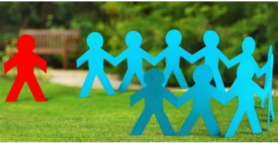
Temario de desarrollo humano integral. 8 etapas del desarrollo humano. Taller de desarrollo humano temario. ¿qué es el desarrollo humano. Como ver las megas de mi internet. Temario desarrollo humano tecnologico nacional de mexico.